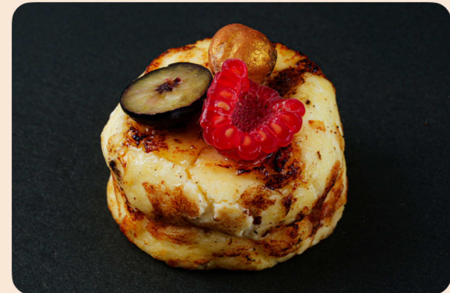
Сырники малина, голубика и трюфельный мед