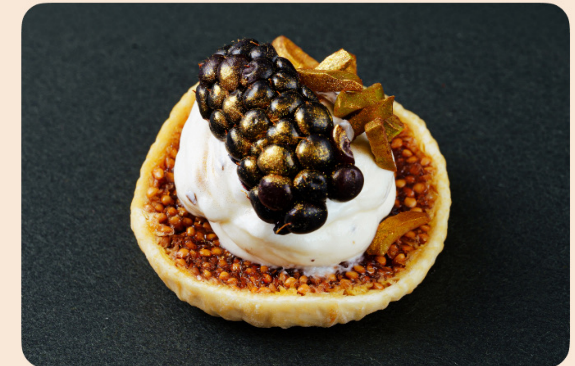
Медово-трюфельный тофу крем сухой инжир, ежевика, рубленая фисташка