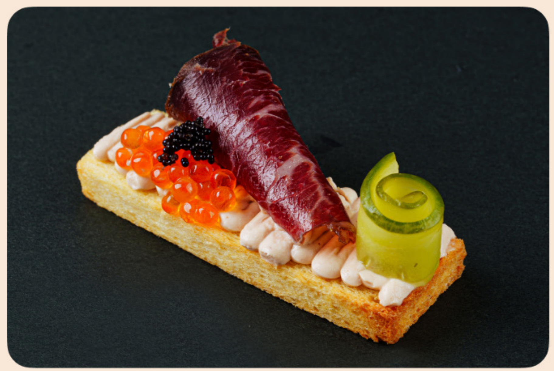
Бриошь с вяленным вагю барбекю соус, маринованный огурчик, красная икра, икра летучей рыбы