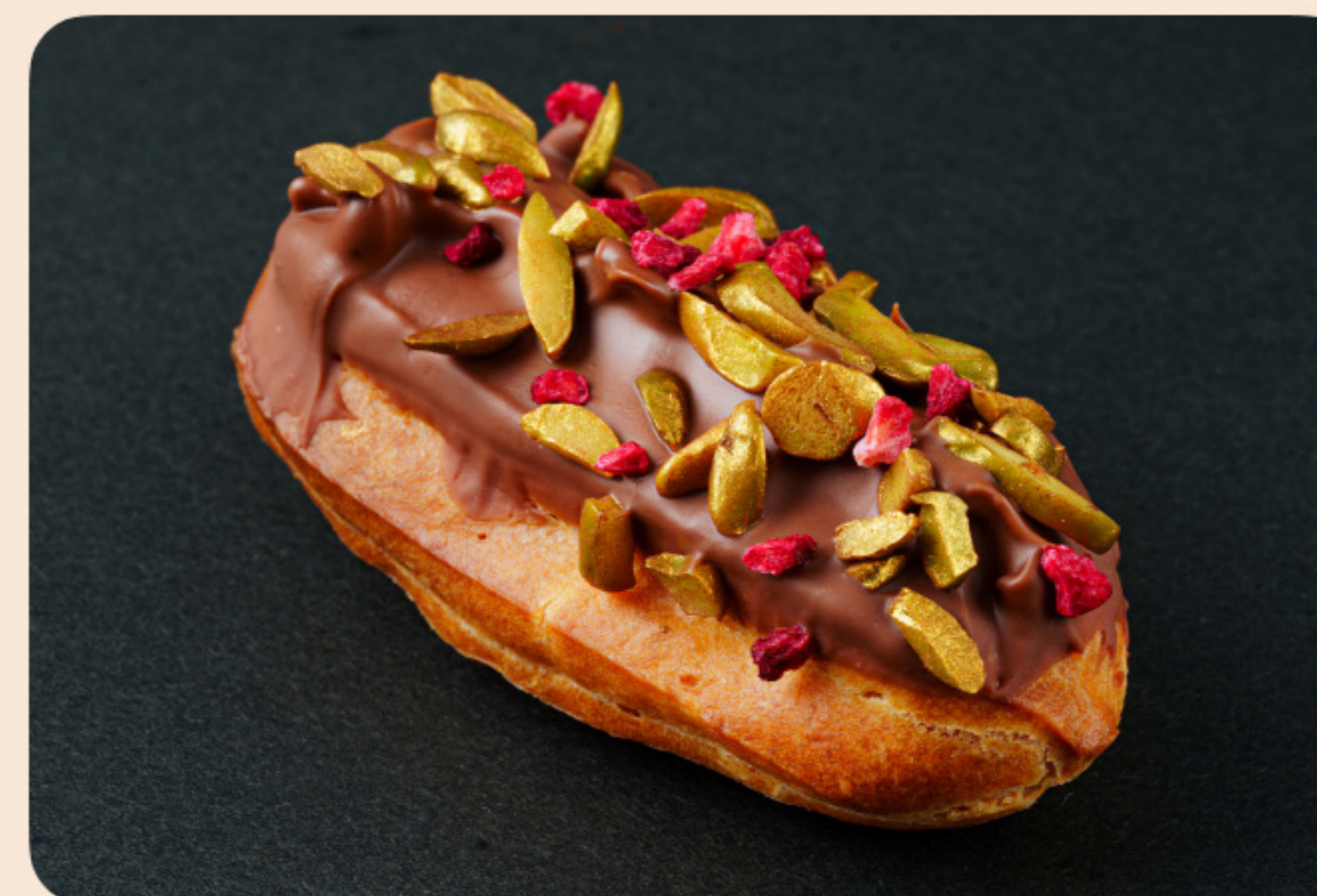
Эклер с малиновым заварным кремом молочный шоколад, сублимированная малина