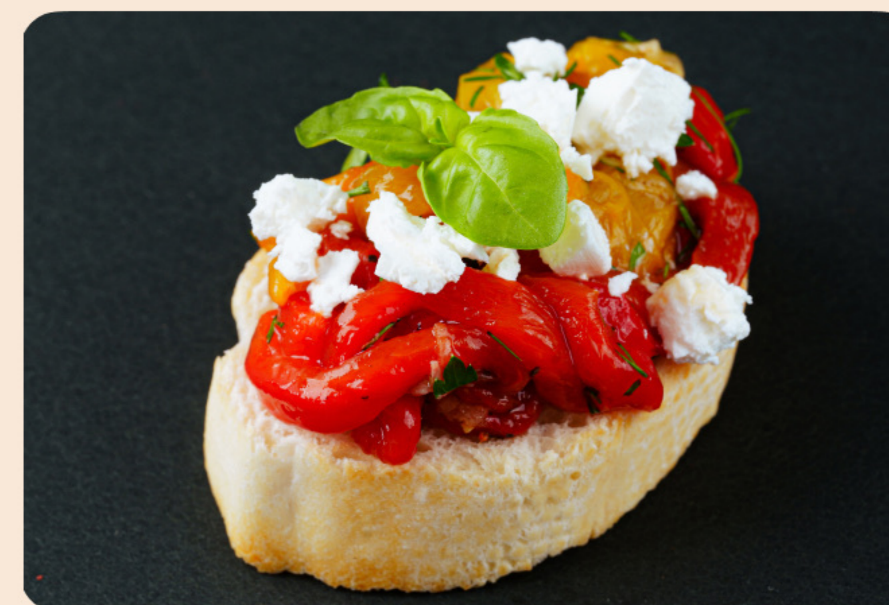
Брускетта с печеным перцем сыр фета, кинза, базилик