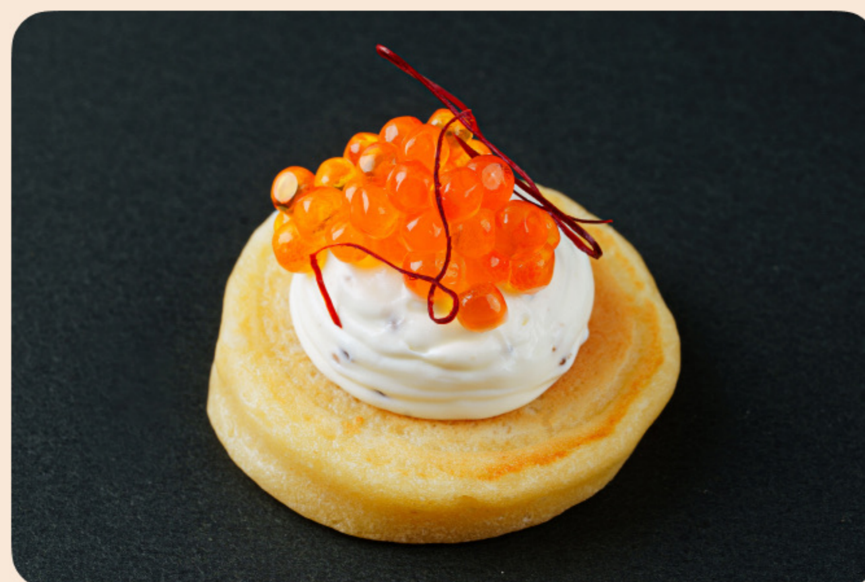
Мини панкейк с красной икрой трюфельная сметана, тогараши