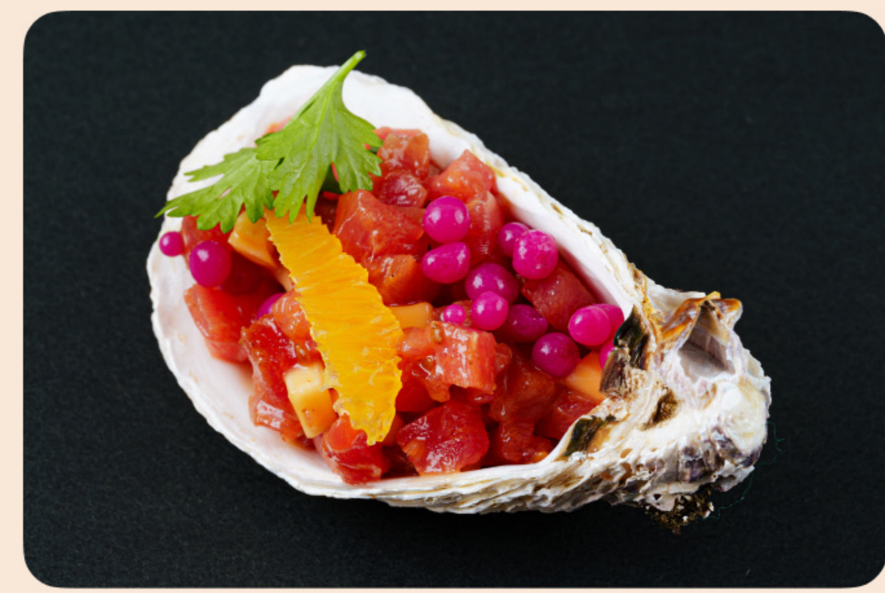
Тартар из тунца Блюфин манго, апельсин, кинза, ореховый соус, молекулярная икра из капусты