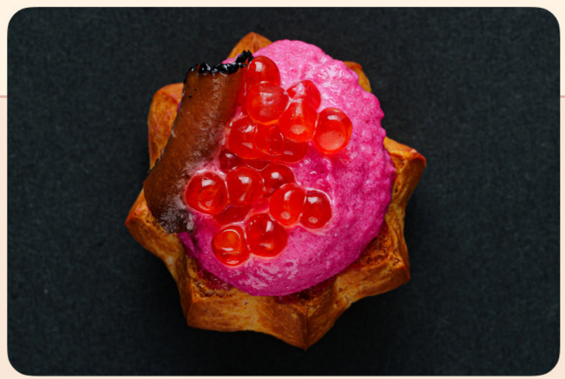
Профитроль с кремом из свеклы и юзу трюфель, красная икра