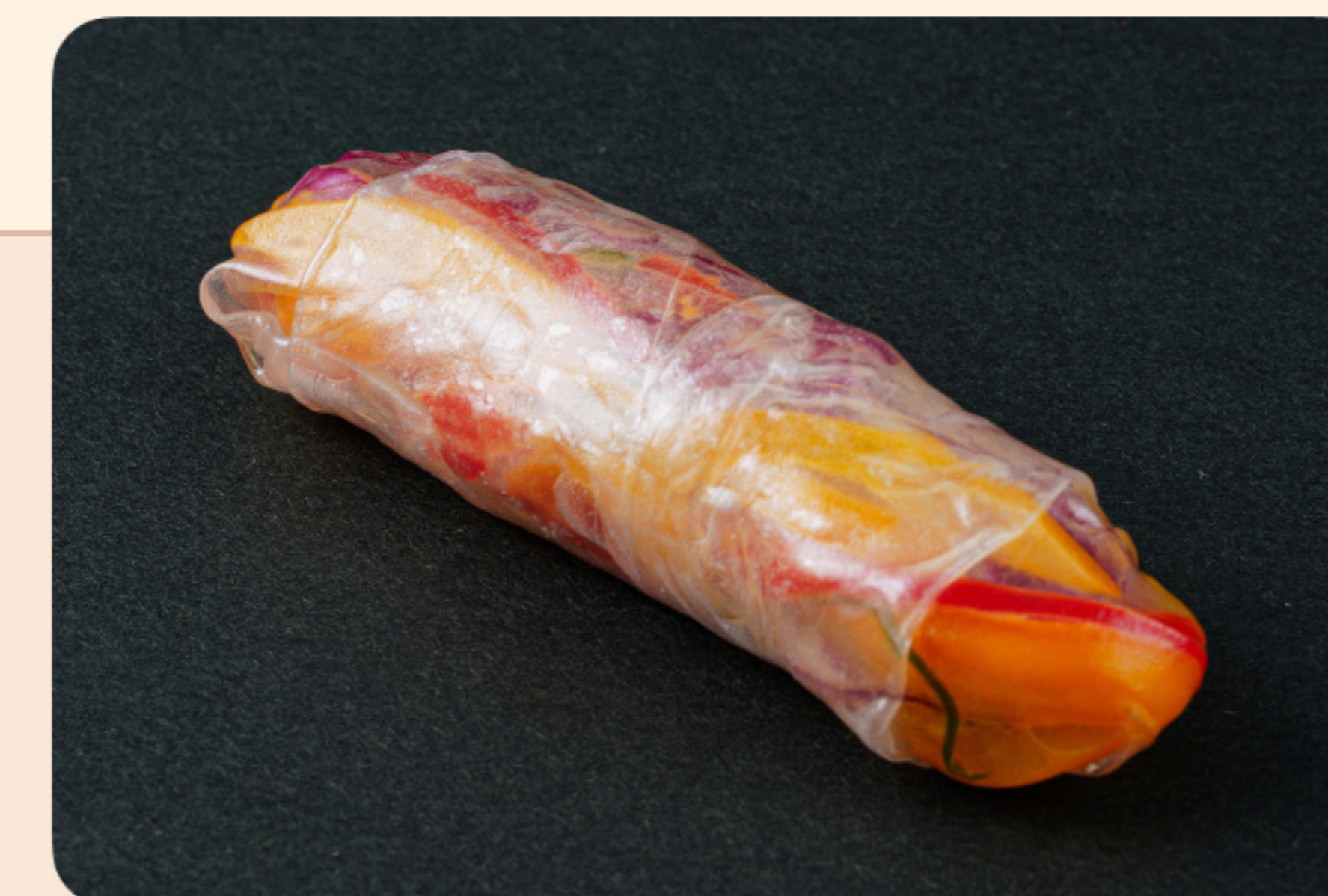
Спринг-ролл с водорослями вакаме болгарский перец, морковь, соус на основе кунжута