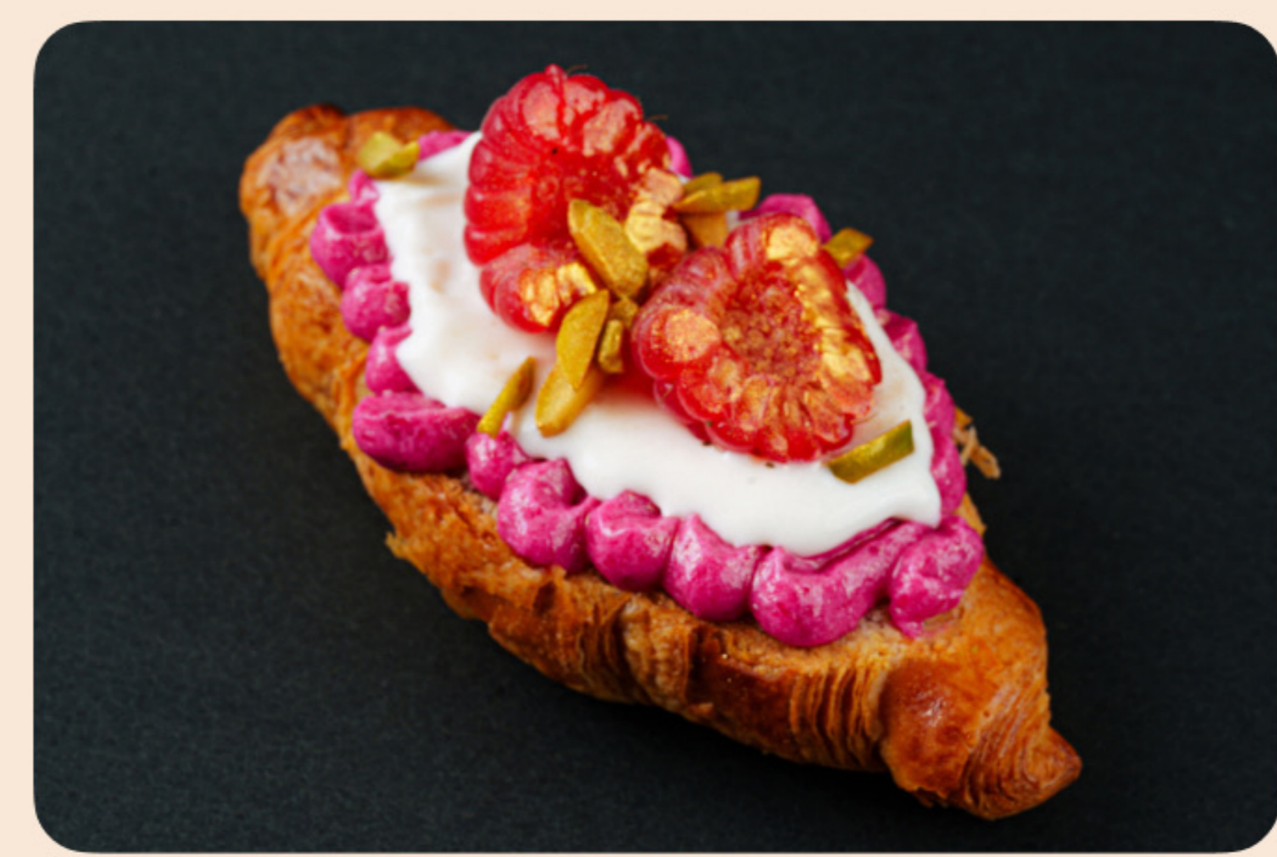
Мини круасан с малиной ванильный соус, юзу крем, фисташка