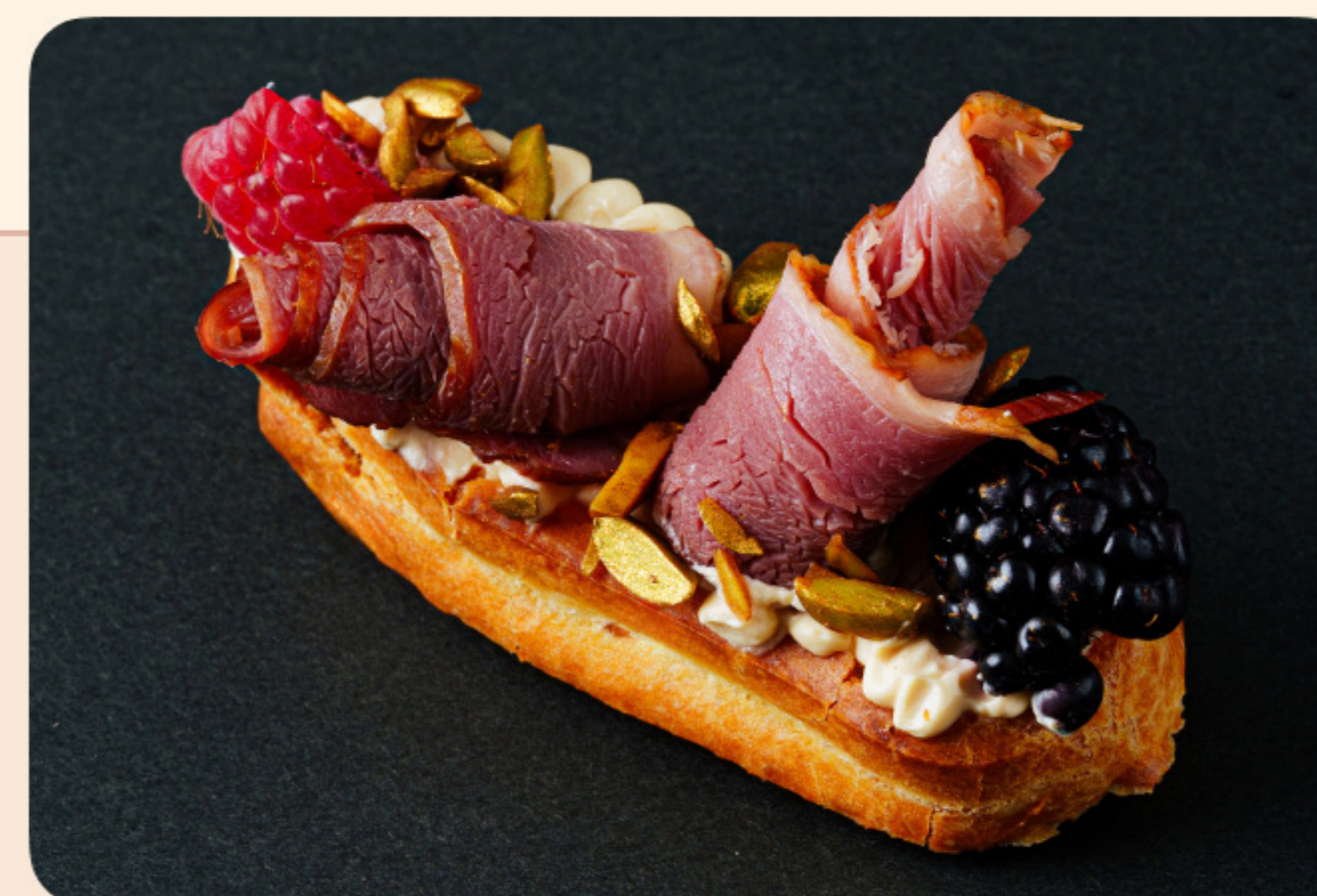
Эклер с копченой уткой копченый соусом, гранат, фисташка