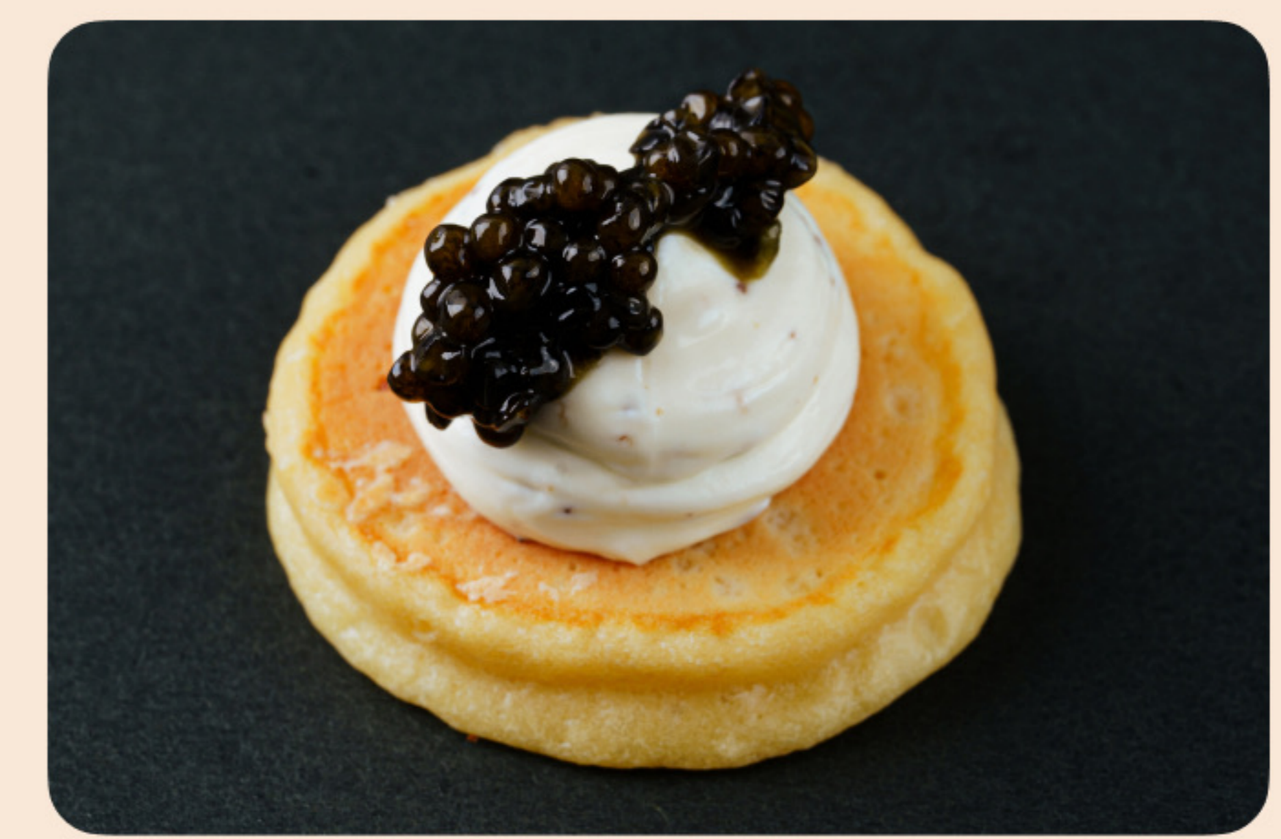
Мини панкейк с черной икрой и трюфельной сметаной