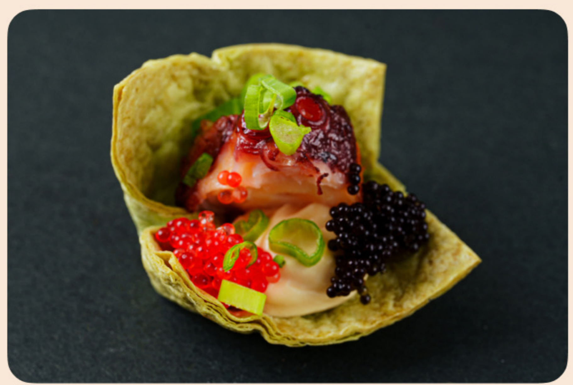
Канане из шпинатной тортильи с осьминогом, ореховым кремом и икрой летучей рыбы