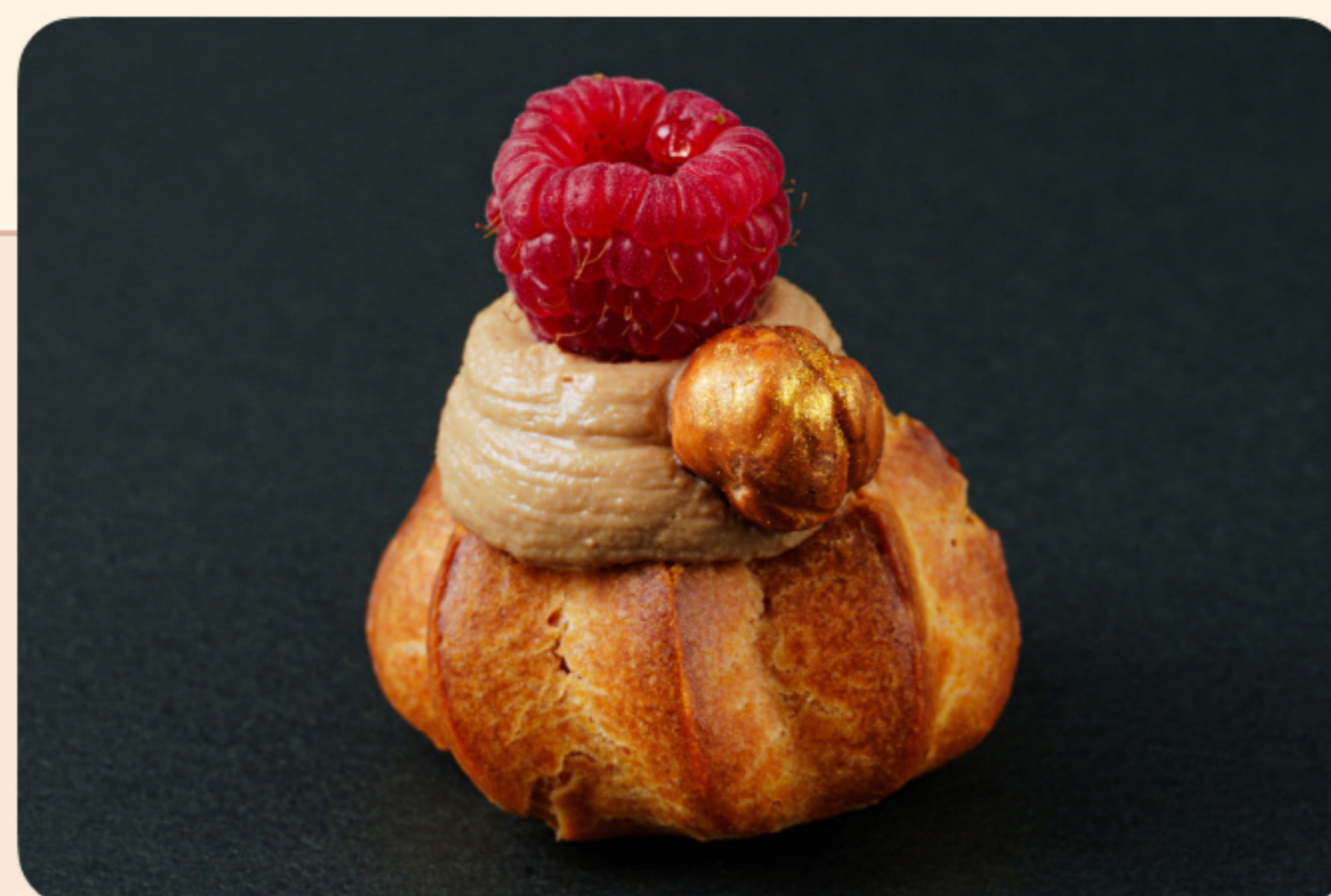
Профитроль с паштетом из куриной печени малина, фундук, трюфельный мед

+971 50 390 63 77 Goose and Gourmet Catering services