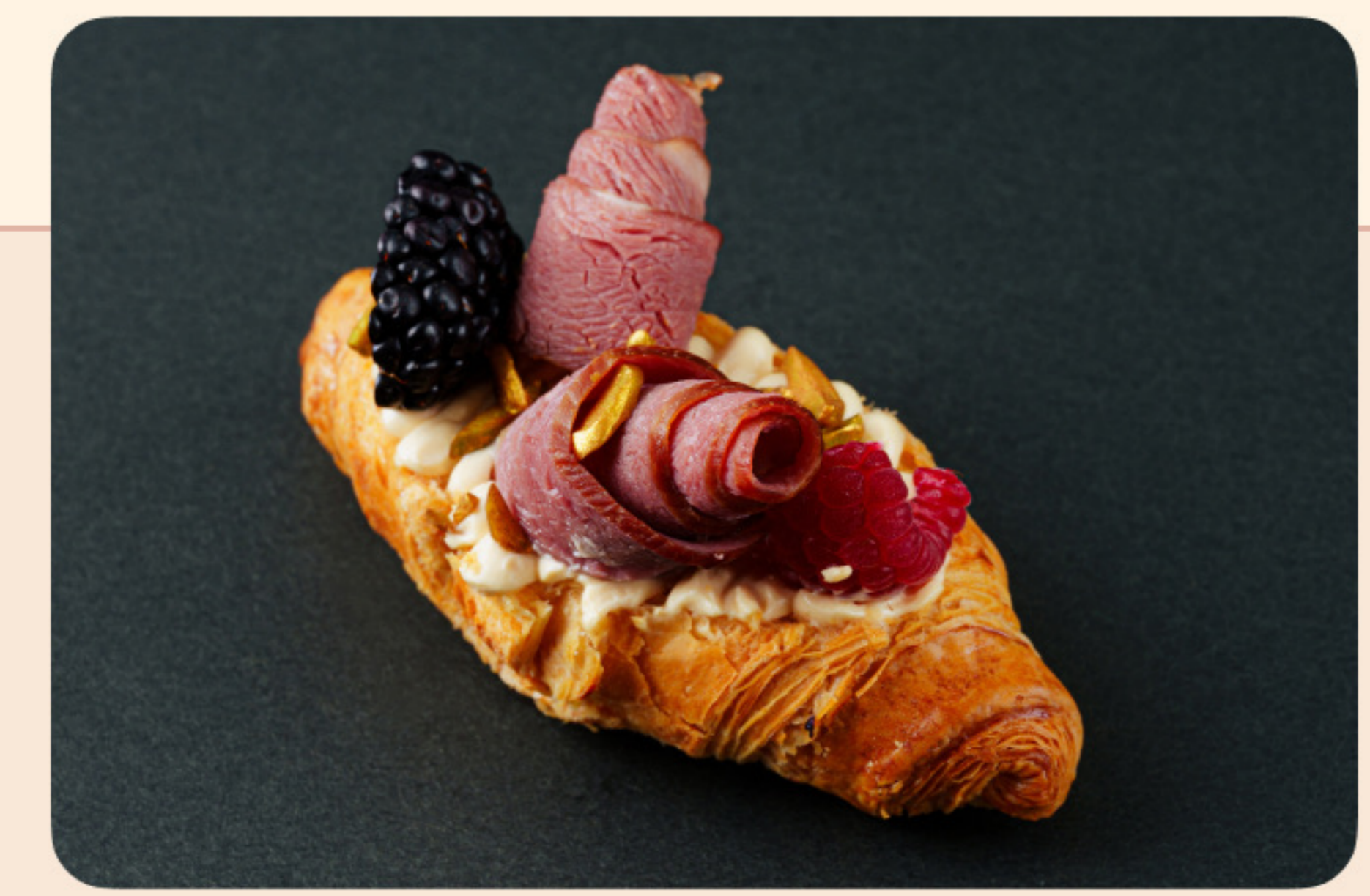
Мини круассан с копченой уткой копченый крем, ежевика, малина, кешью в золотом напылении, сублимированная малина