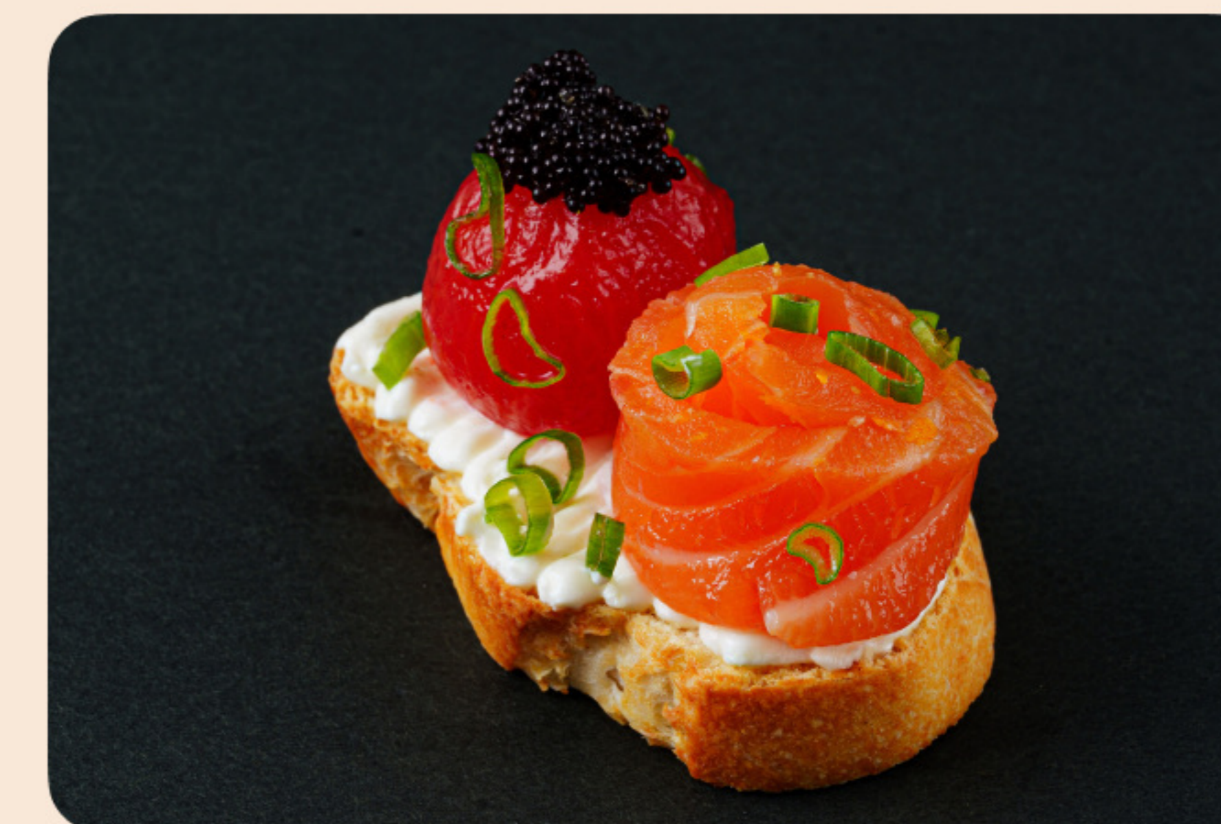
Брускетта со слабосоленым лососем лаймовый крем-сыр, томаты черри, соленый огурчик, крем из юзу и свеклы