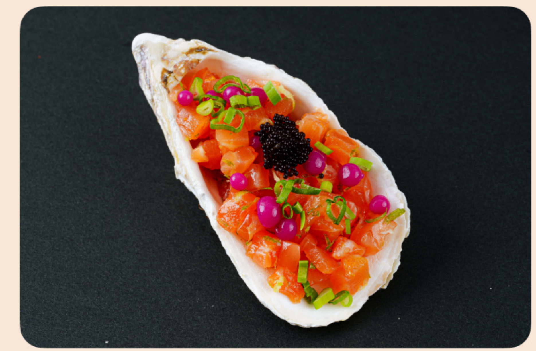
Тартар из слабосоленого лосося цедра лайма, крем из лайма, икра летучей рыбы