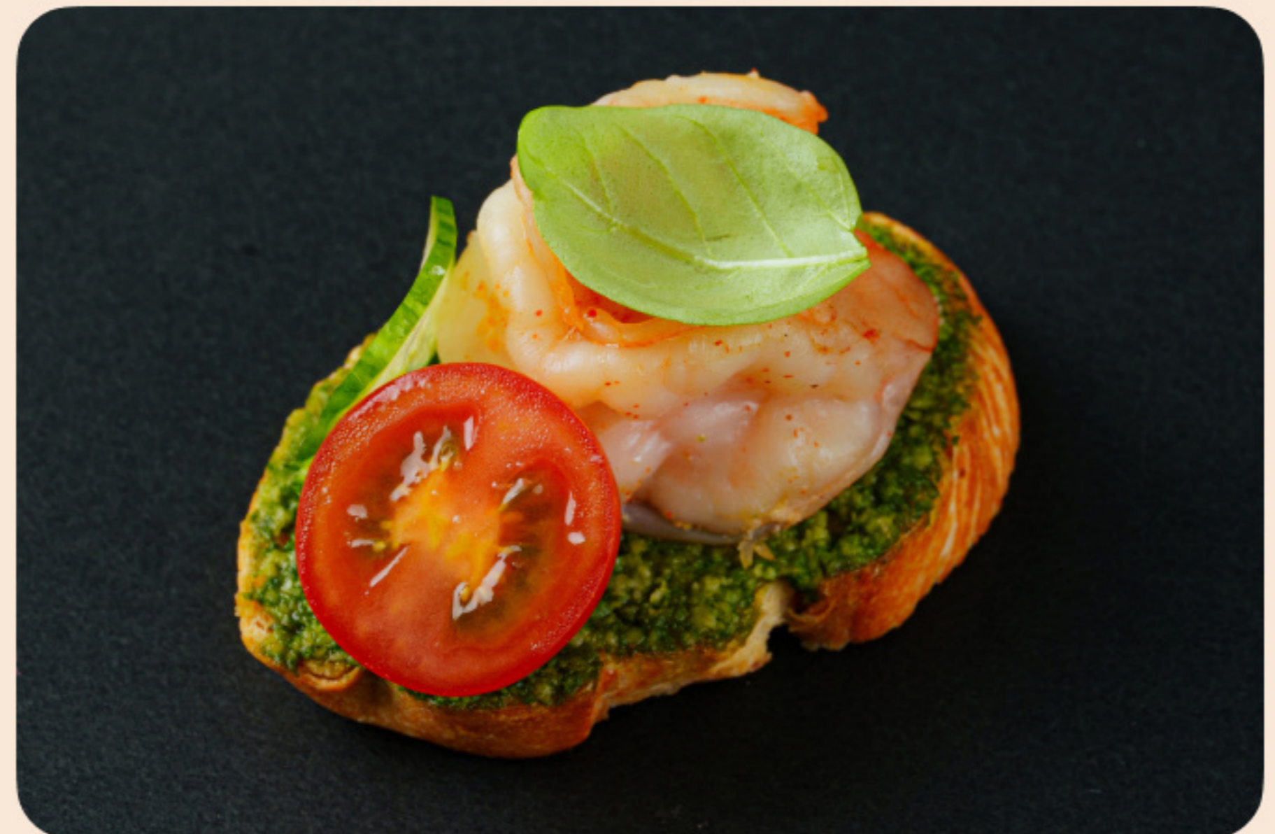
Брускетта с креветкой соус песто, томаты черри, огурчики