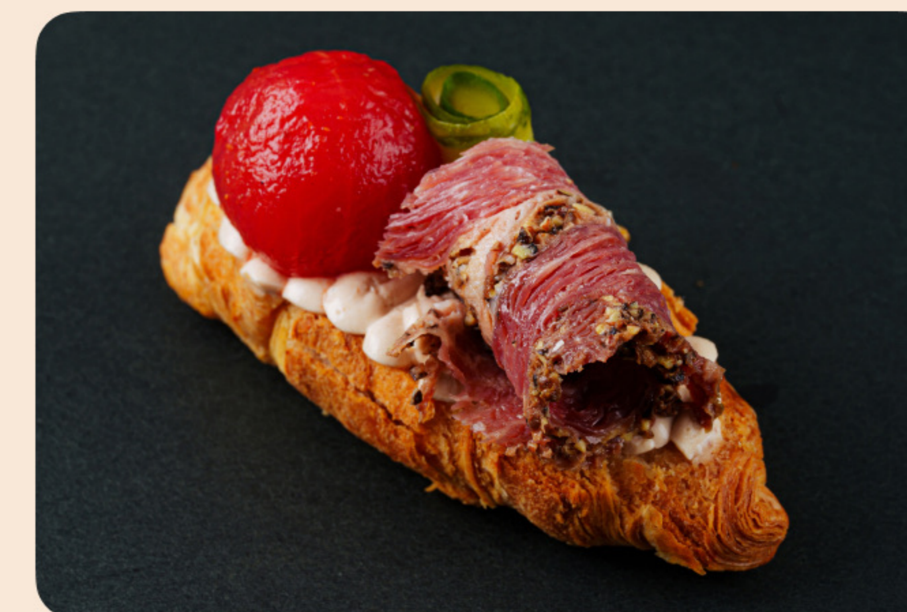
Мини-круассан с пастроми барбекю соус, маринованный огурчик, сумах