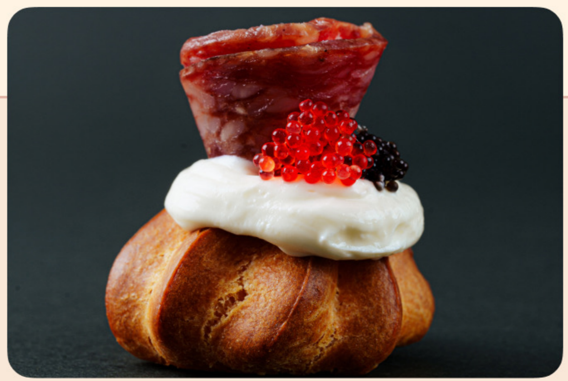
Профитроль с кремом из камамбера икра летучей рыбы, трюфельное салями, фисташка в золотом напылении

+971 50 390 63 77 Goose and Gourmet Catering services