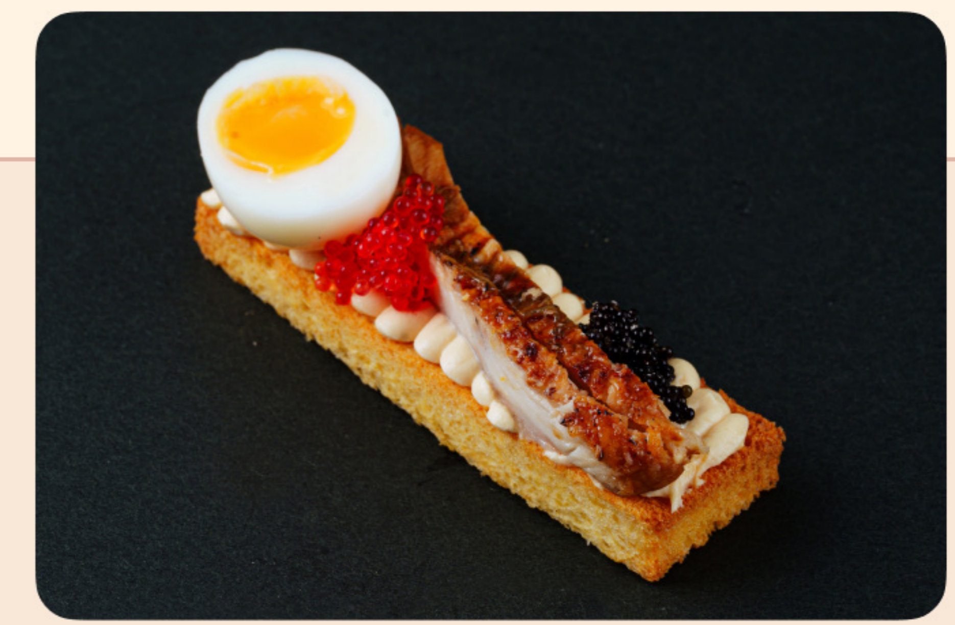
Бриошь с копченым угрем ореховый соус, перепелиное яйцо, икра летучей рыбы, сумак