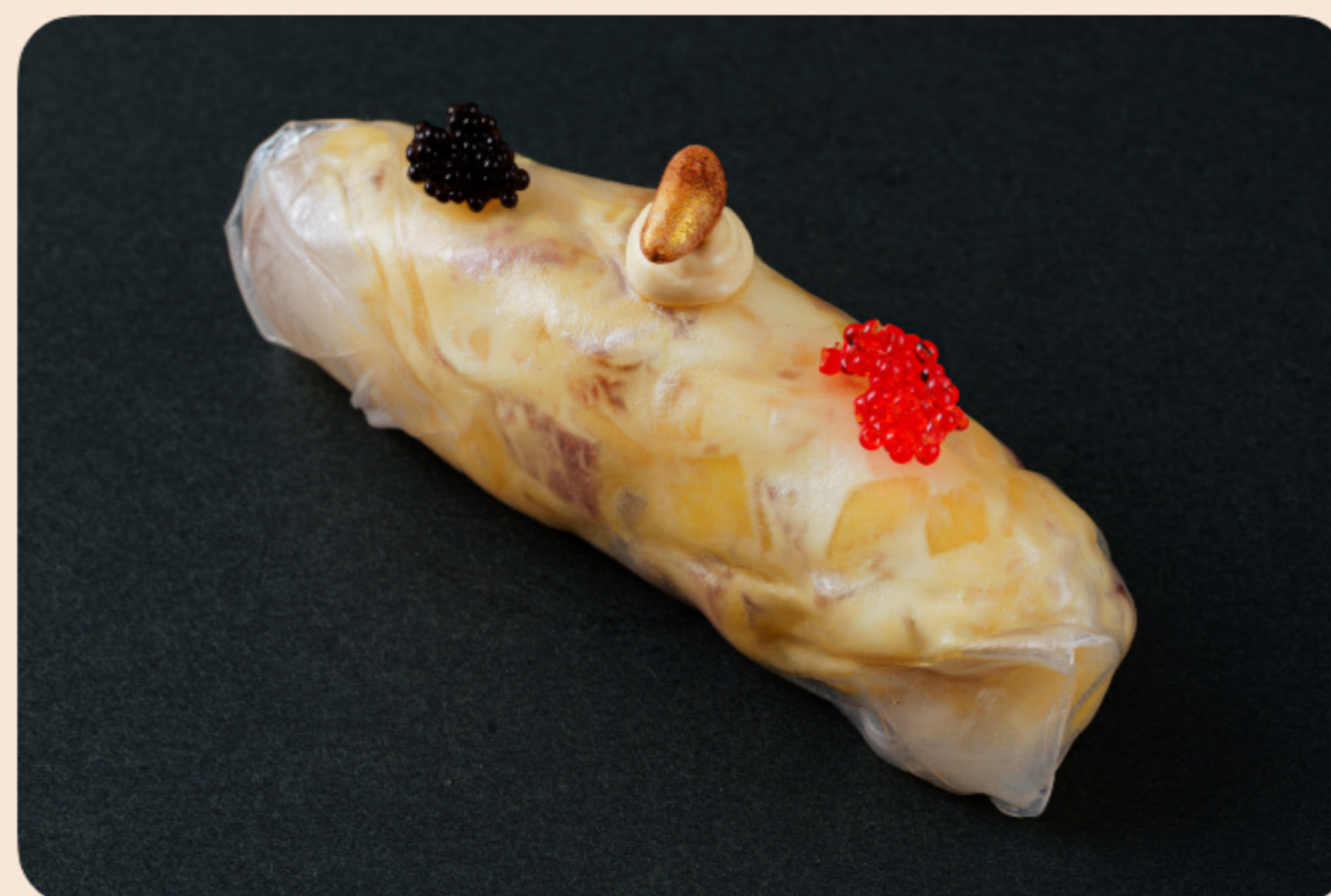
Спринг ролл с копченой уткой соус хайсин, икрой летучей рыбы, кешью