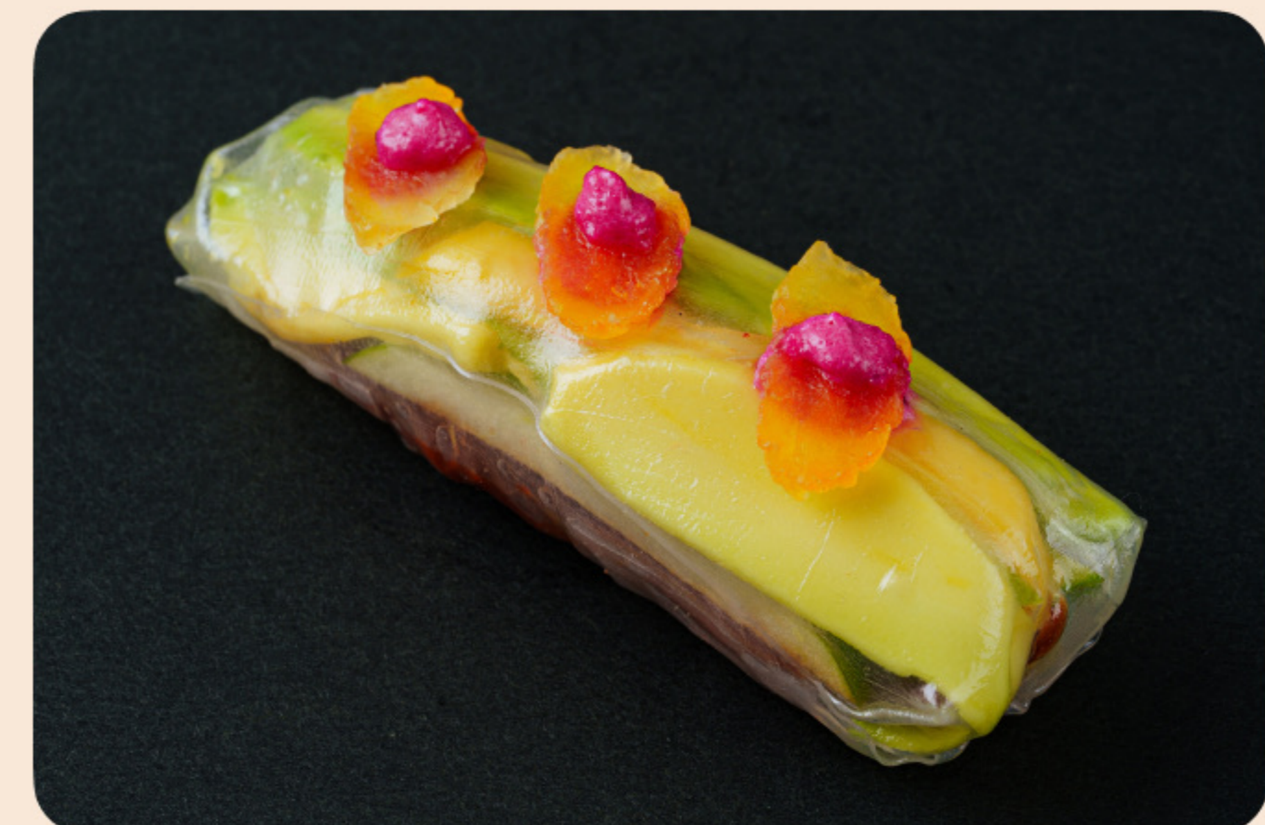
Спринг-ролл с авокадо манго, яблоко, вяленые томаты, сушеный абрикос