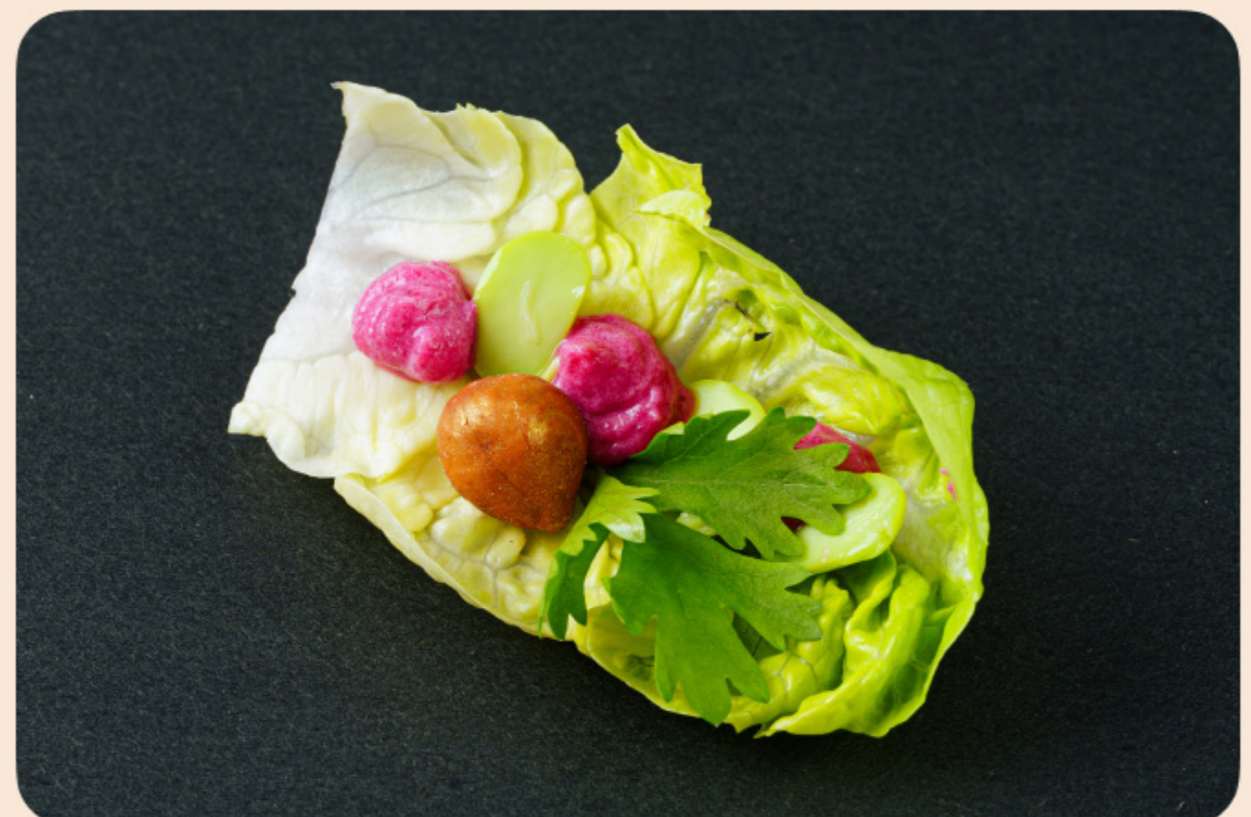
Мини лист ромена с юдзу-свекольным кремом бобы эдамаме, сухой абрикос, кинза, фисташка в золотом напылении