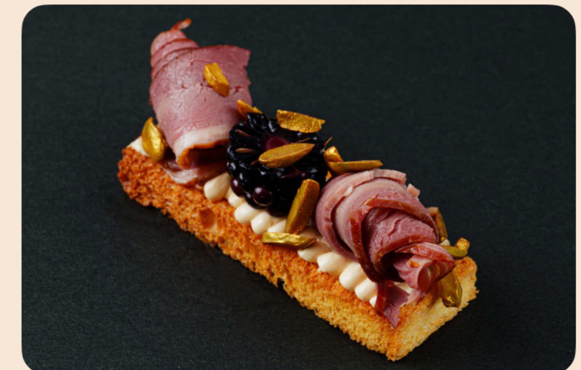
Бриошь с копченой уткой копченый крем, ежевика, фундук, фисташка, сублимированная малина