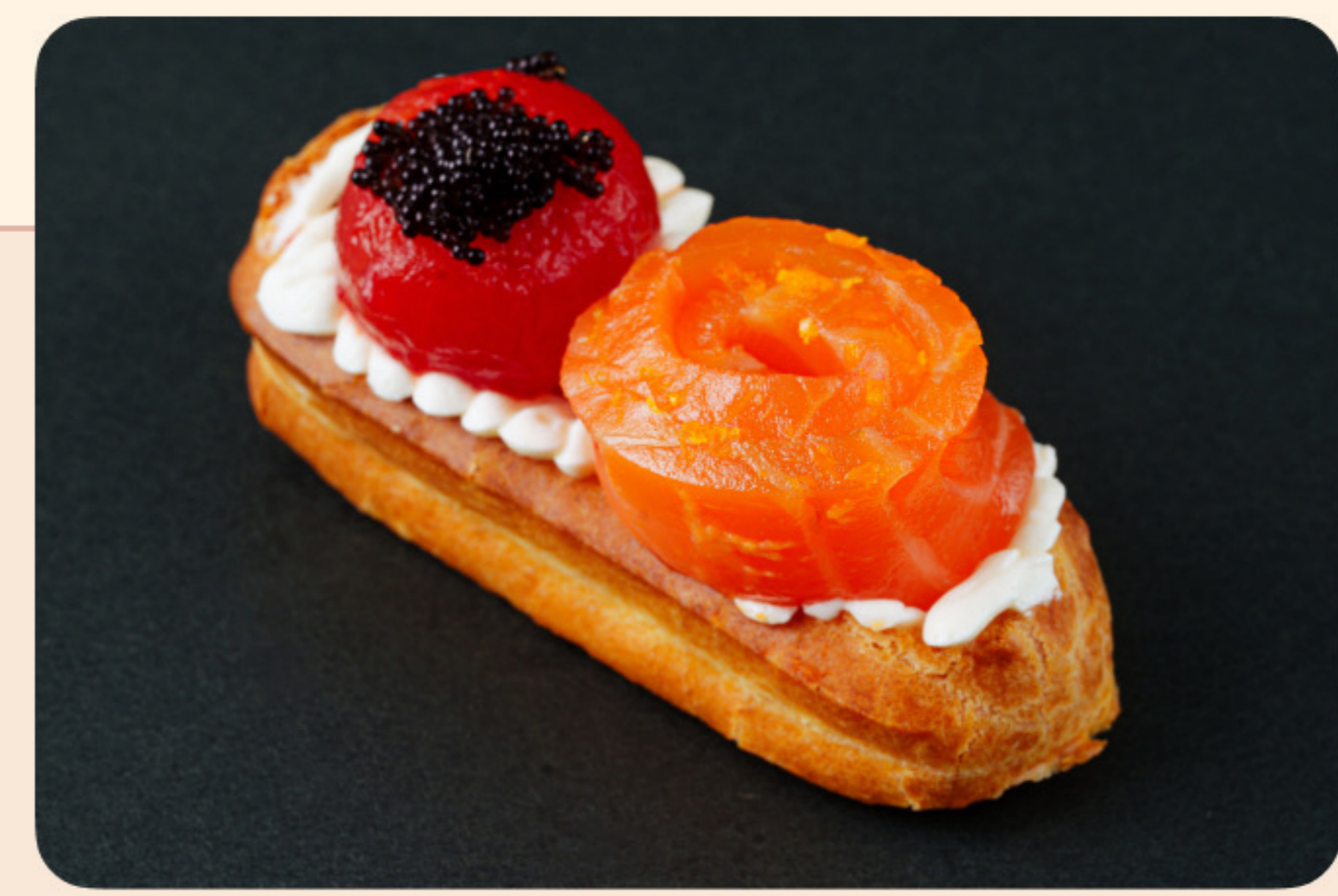
Эклер с лососем лаймовый крем-сыр, томаты кимчи, икра летучей рыбы, сумак-пудра, золотое напыление